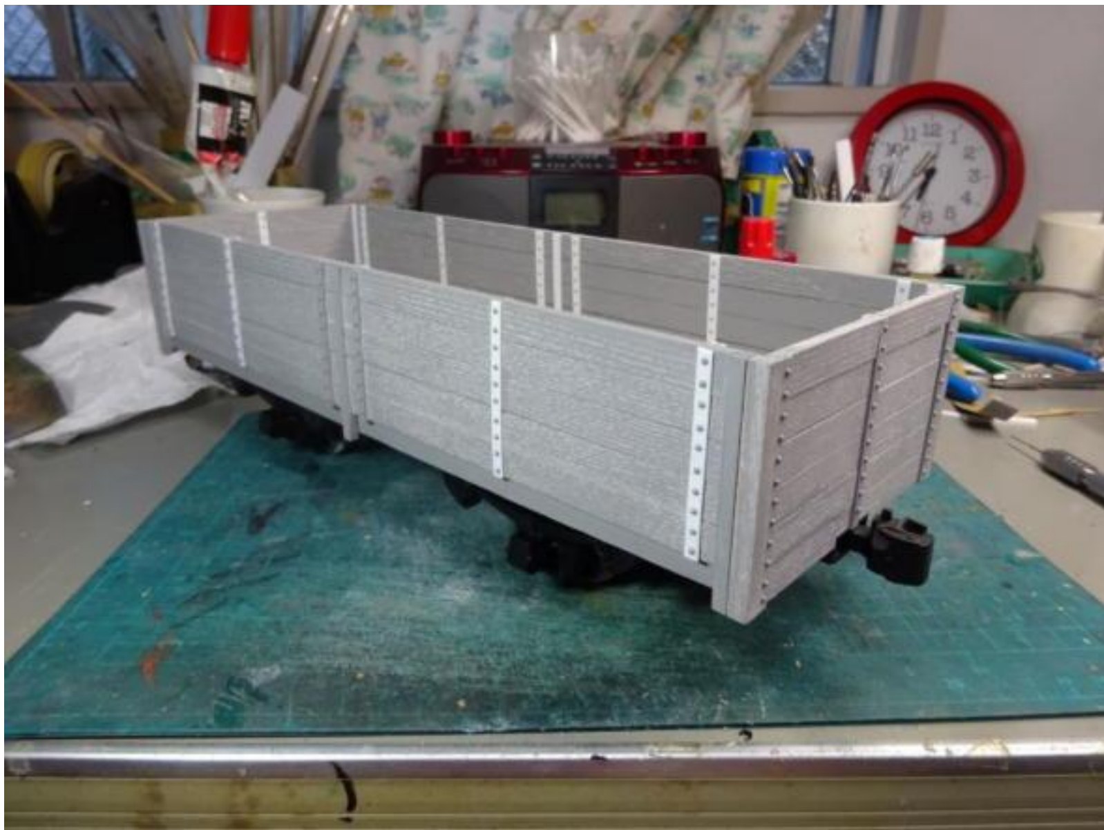
帯板貼ってから、リベット貼り。 疲れたあ・・・